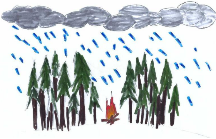
Ένα συναίσθημα μοναξιάς

Ένα μοναχικό σκοτεινό δάσος στο οποίο βαθιά μέσα του υπάρχει μια φωτιά, η οποία συμβολίζει τα άτομα που είναι ακόμα εδώ και με στηρίζουν. Η φωτιά ακόμα και που βρέχει, δεν σβήνει. Αυτό σημαίνει για μένα ότι οι άνθρωποι που είναι εδώ και με στηρίζουν δεν θα με εγκαταλείψουν σε μια δύσκολη στιγμή.