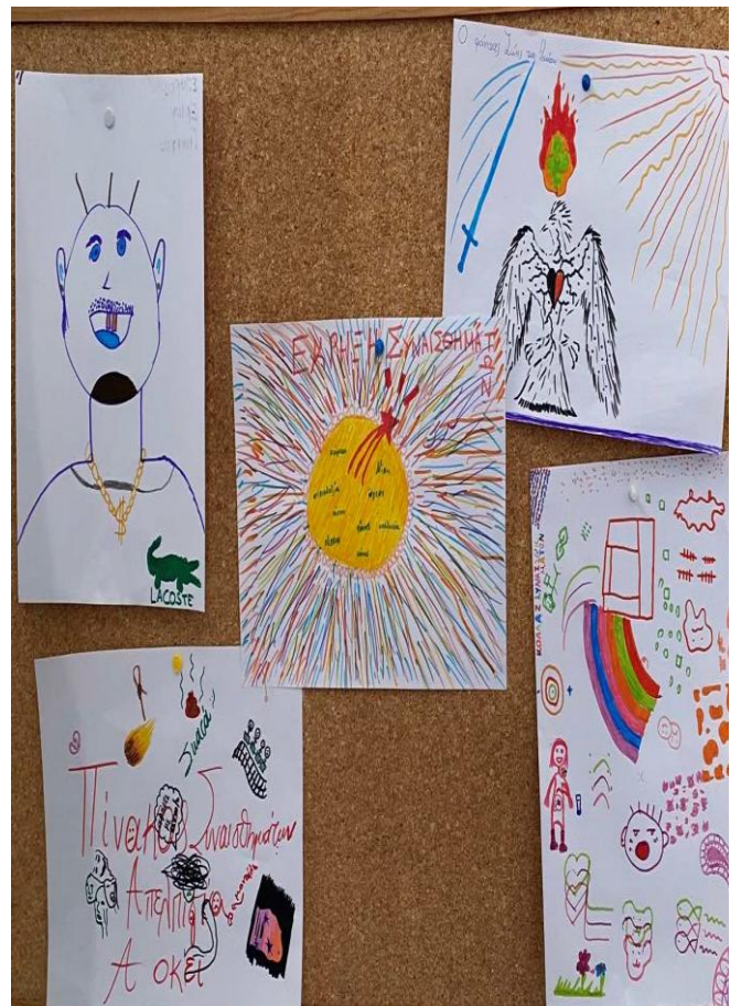
ΕΠΑΛ -Γ' ΤΑΞΗ